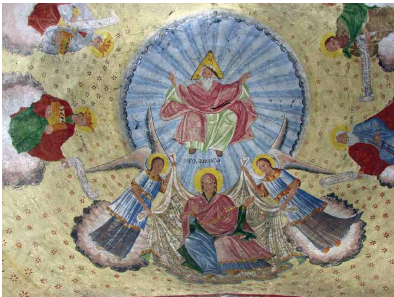
2. Храм „Св. Димитър” в село Тешово, Гоцеделчевско – Богородичен Акатист