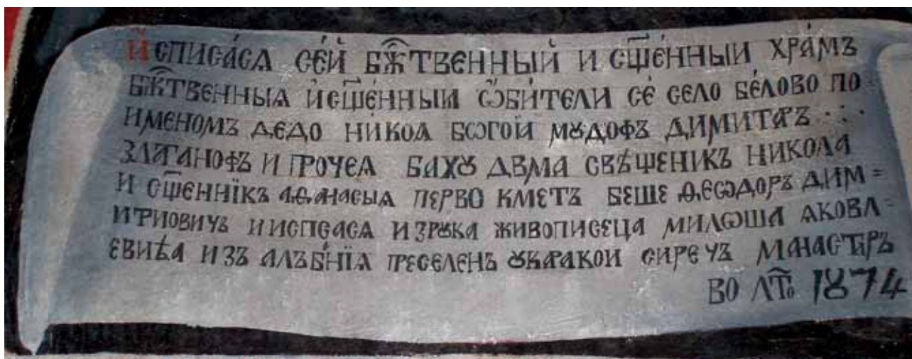
3. Храм „Св. Атанасий” в село Бельово, Мелнишко – Възпоменателен надпис