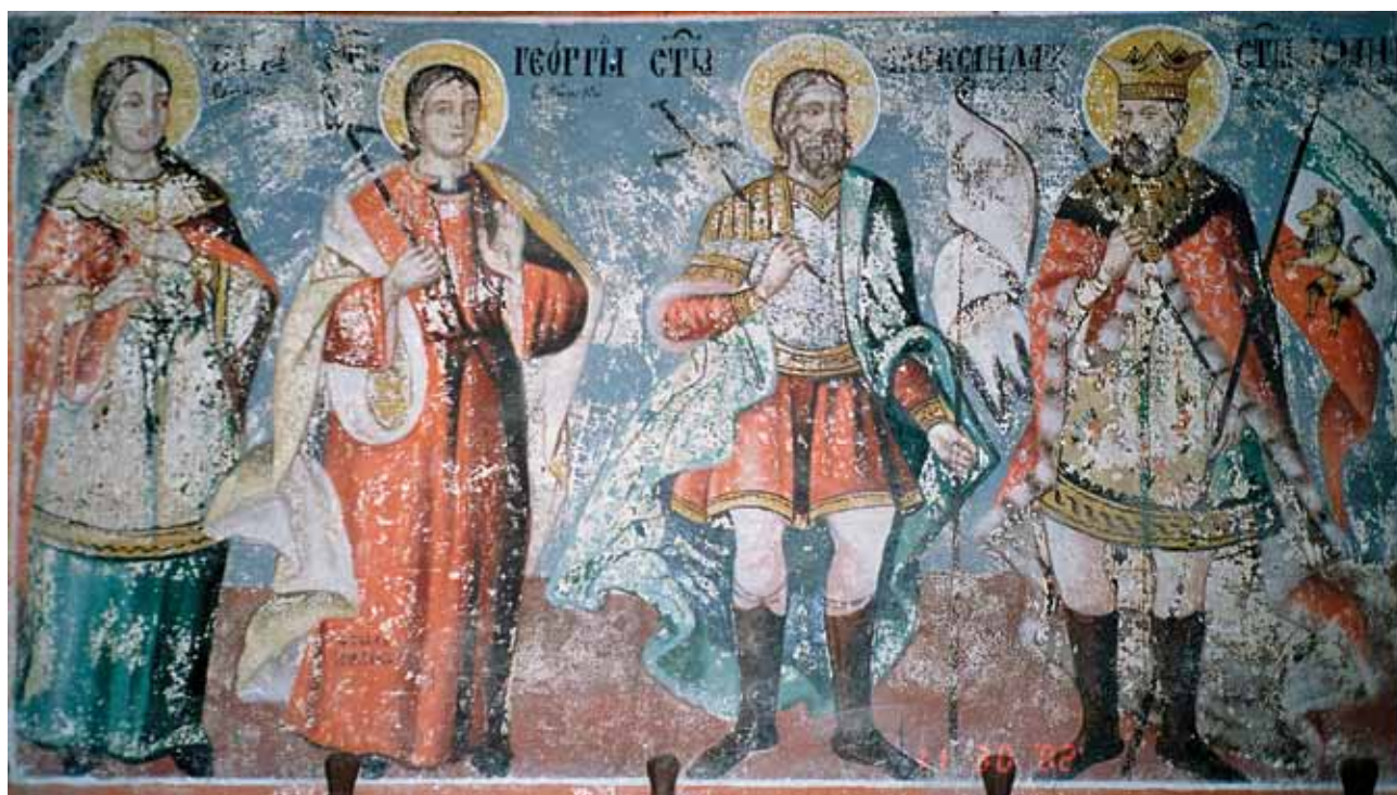
б. Храм „Св. Никола” в село Тополница, Дупнишко – св. Васа Софийска (Солунска), св. Георги Софийски, св. Александър Невски и св. цар Йоан Шишман

на XIX в. Преселил се е от Галичник в Каракьой и рисувал икони в близките селища 13 . Според Асен Василиев селищата, в които е работил, сега са отвъд граница 14 . Авторът не е отбелязал нито един паметник или селище, в което са идентифицирани негови стенописи. Милуш е обучил и сина си Леонтия 15 (Левчо), преселил се след Балканската война в гр. Дупница 16 .