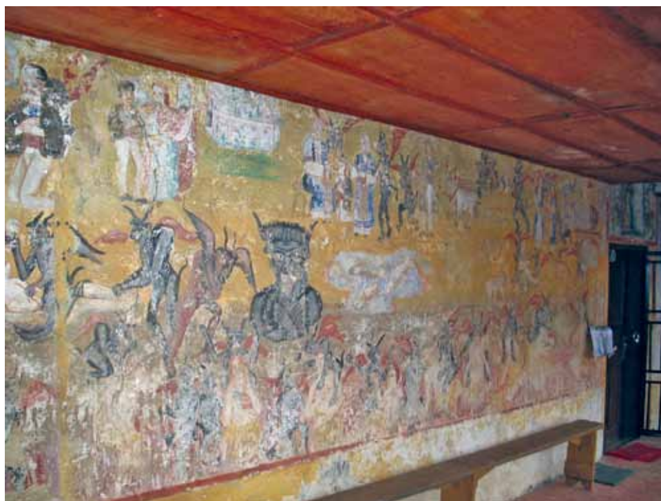
10. Храм „Св. Никола“ в село Червен брег, Дупнишко – Страшният съд