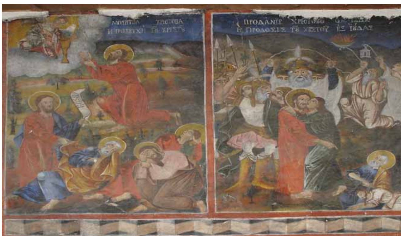
Храм „Св. Георги” в село Златолист, Мелнишко – Снят в Гетсиманската градина и Предателството на Иуда