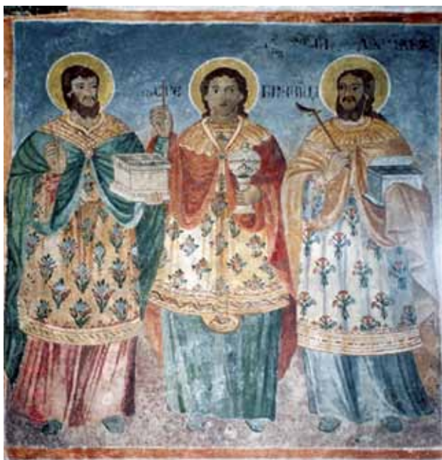
8. Храм „Св. Георги“ в гр. Сапарева баня – св. Безсребреници (Козма, Дамян и Панталеймон)