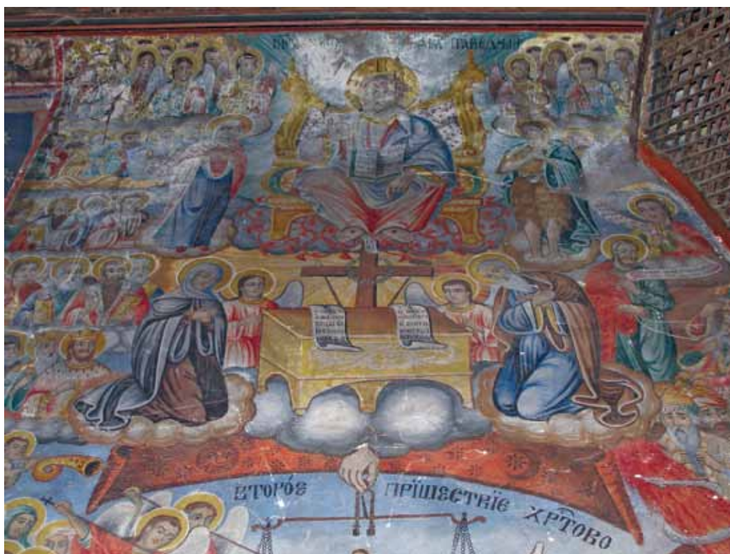
14. Храм „Св. Никола” в село Долен, Гоцеделчевско – Страшният съд

на местния бей в Мелник 27 . В Долен, Капатово 28 , Рупите и Червен брег 29 са изградени камбанарии. Камбанарията на храма в с. Долен е с часовник над главния (западен) вход на храма. Всички тези църкви са типични за храмовата архитектура от средата и втората половина на XIX в. По техните фасади липсва каменна пластика и друга украса. Според третия принцип, по който групирам паметниците, църковното строителство е в подем през XIX в. и особено след Кримската война. В някой от по богатите селища храмове се изграждат и преди войната. Възможностите за стенописната украса обикновено настъпват няколко десетилетия след изграждането на храма.