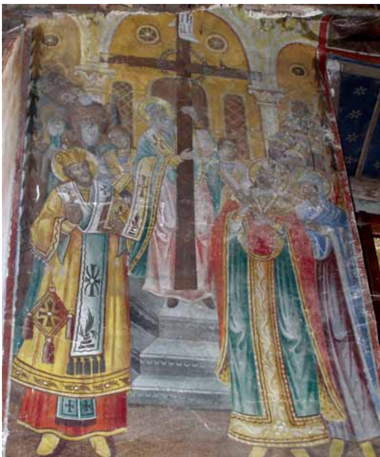
13. Храм „Св. Никола” в село Долен, Гоцеделчевско – Въздвижение на Честния кръст

„Св. Никола” в с. Тополница. Както става ясно от вградената дата, той е построен през 1856 г. 24 . Вградената дата е и единственото свидетелство за строежа на храма, тъй като летописната книга е загубена. Според местното предание, когато се строяла църквата, един от жителите на селото отказал да участва в строежа. Тогава неговите съселяни го принудили да пренася камъни, защото в градежа на храма трябвало да участва цялото население от селото.