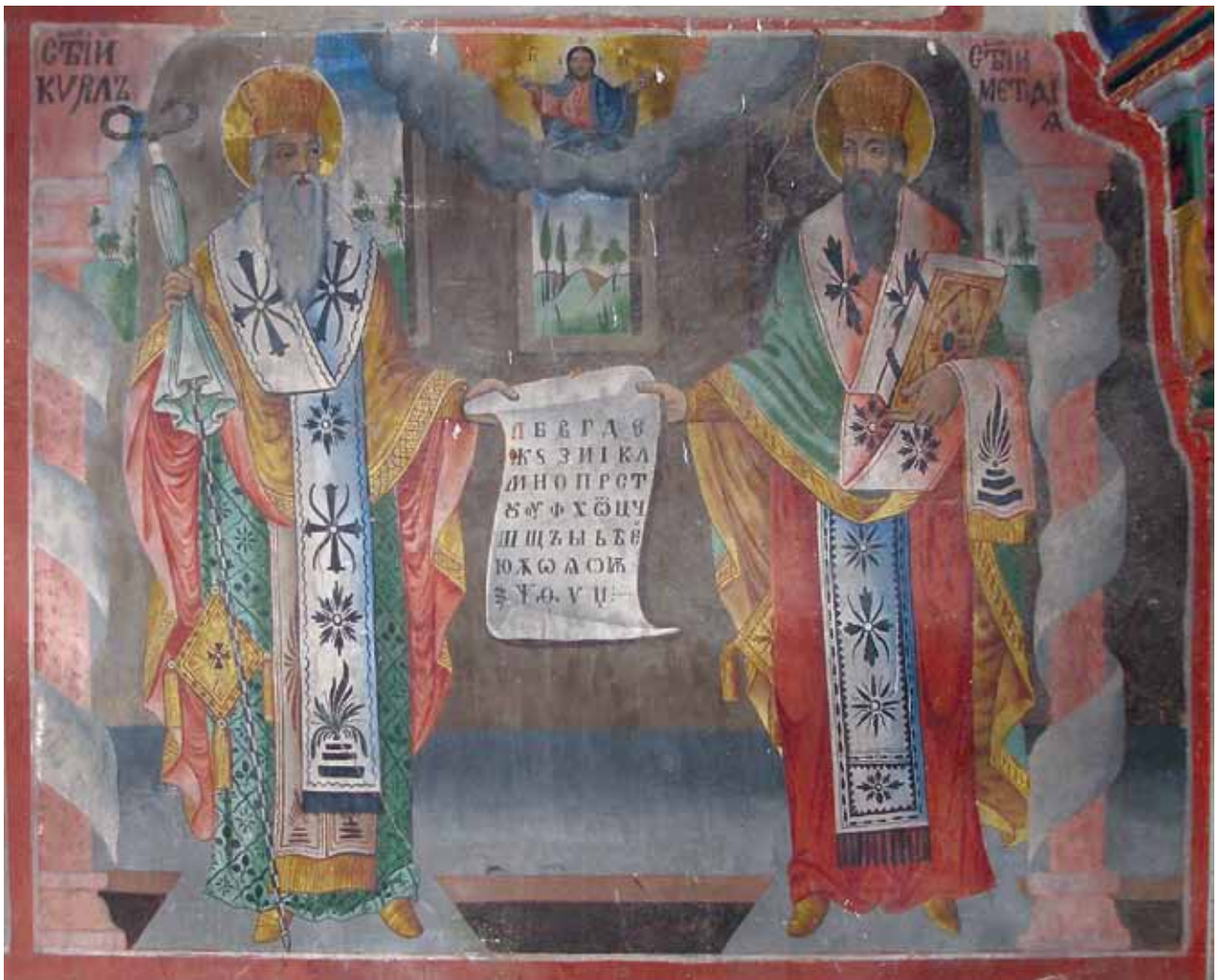
5. Храм „Св. Атанасий” в село Бельово, Мелнишко – Св. св. Кирил и Методий