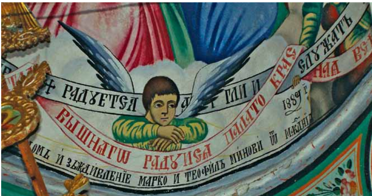
15. Храм „Св. св. Кирил и Методий” в село Багреници, Кюстендилско – Ангел и надпис от композицията св. Богородица – Господарка на ангелите

едно единствено стенописно изображение, разположено в протезисната ниша на олтара, което представя сцената „Христос в гроба плътски” – изображение, традиционно за тази част на православния храм. Протезисната ниша има важно литургично значение, в нея се подготвят хлябът и виното за проскомидия, в нея също така се съхранява и сухото причастие. Това важно функционално значение дава основание на настоятелите да поръчат изписването ѝ преди основната част на храма. Подобен е случаят в църквите на селата Тополница 30 и Червен брег 31 , като тук представям само примери от кръга произведения на зографите Минови. В село Палатово изображението е от 1908 г. – една година след приключване на строителството на храма.