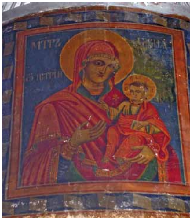
16. Храм „Св. Богородица” в село Руните, Петричко – св. Богородица Одигитрия