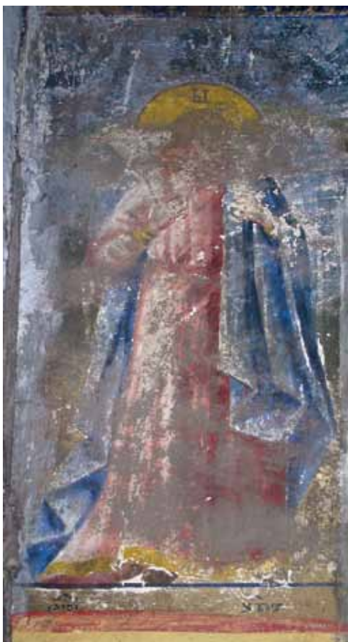
9. Храм „Св. Никола“ в село Червен брег, Дупнишко – Притчата за изгубената овца