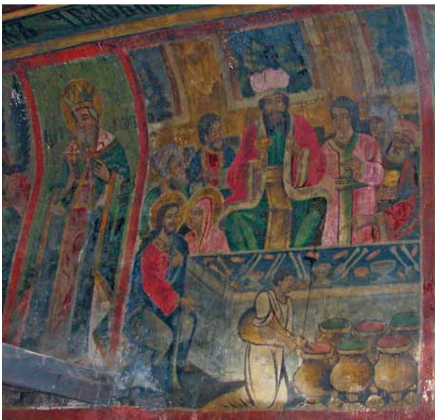
11. Храм „Св. Богородица Живоносен източник“ в село Капатово, Петричко – Притча за Богатия и бедния Лазар