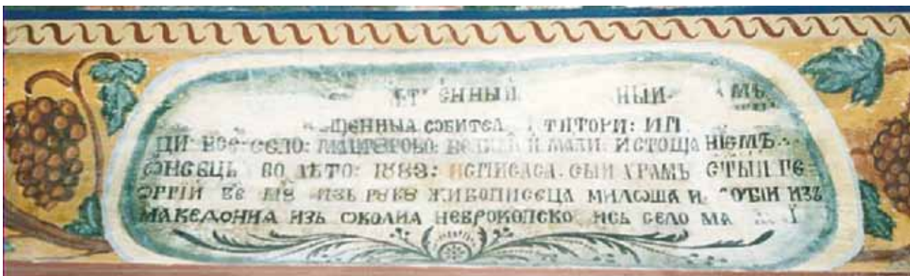
7. Храм „Св. Георги“ в гр. Сапарева баня – Възпоменателен надпис